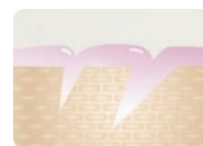
うるおいヴェール